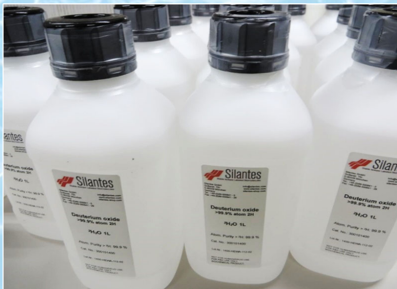
イメージ写真: 内容量1 L(容器:HDPE-UNボトル)