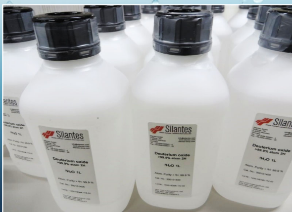
イメージ写真: 内容量1 L(容器:HDPE-UNボトル)